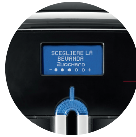
Un design moderne et raffiné